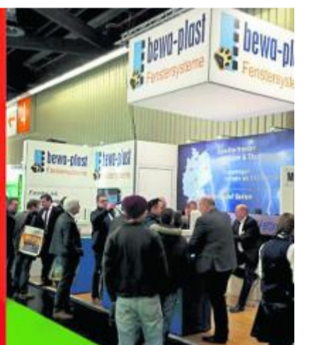
Der bewa-plast-Stand auf der BAUExpo in Halle 8, D3.