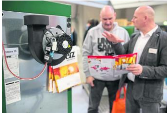
Messe zum Anfassen: Viele Aussteller bringen Musterstücke und Exponate mit. Geballte Expertenpower: Beratung vom Fachmann.