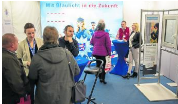
Die Themen Barrierefreiheit und Gebäudesicherheit (rechts) können – wie auch der Bereich SMART.HOUSE – fließend ineinander übergehen.

Sicherheit sollte in jedem Haushalt großgeschrieben werden. Sie beginnt bereits beim Aufbau eines Gebäudes oder beim Einsatz von Rauchmeldern, geht über die Installation von Alarm- und Sicherheitsanlagen bis hin