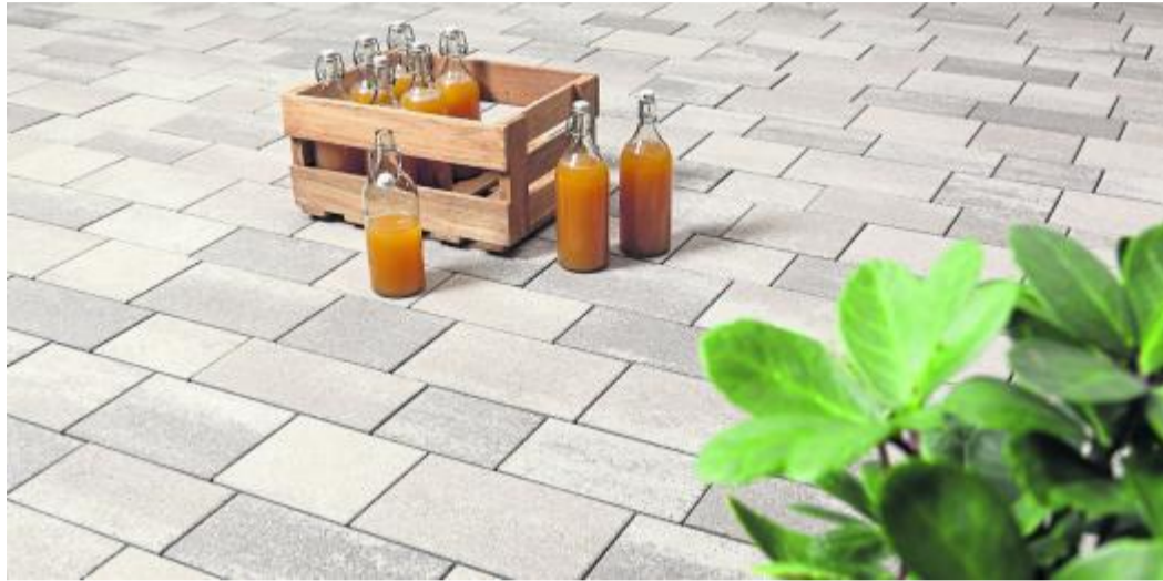
Neu: Das Pflastersystem Lukano rinnit Sonora-Beige für moderne Einfahrten, Höfe und Wege.