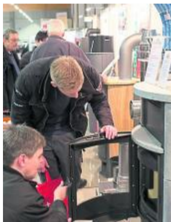
Energieeffizientes Heizen ist immer ein interessantes Messthemema.

Sowohl beim Neu- als auch beim Umbau spielt das barriere-