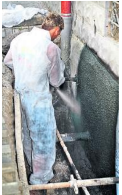
So einfach und sauber funktioniert das Abdichten mit Hilfe des Saugbaggers

KIRCHZELL. Wenn in den Kellerwänden Feuchtigkeit festzustellen erfolgt, eine zugestellte Wärmeisolierung außen andrückendes Wasser die Ursache. Bisher musste die Kelleraußenwand oftmals aufwändig mit schwerem Gerät freigelegt werden, um die Abdichtung mit Bitumen oder anderen Schichtungen vorzunehmen. Ein Unternehmen aus dem Odenwald, Bautenschutz Zieger, bietet seit einiger Zeit ein neues Verfahren an. Hierbei wird der Arbeitsschacht rund um das Haus durch einen sogenannten Saugbagger freigelegt. Das Fahrzeug ist im Prinzip ein sehr starker Staubsauger, der das Erdreich einfach absaugt. Diese Erde wird in einem Container aufbewahrt und kann, wenn gewünscht, wieder zum Schließen verwendet werden. Steine werden mit abgesaugt und Versorgungsleitungen bleiben intakt. Der Vorteil liegt auf der Hand: Hof und Garten oder Gehwege werden geschont, die Baustelle kann meist sehr klein gehalten werden und schnell geht es noch dazu. Das schont Nerven und Geldbeutel der Hausbesitzer.