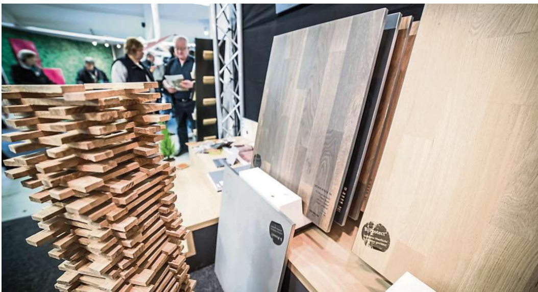
„Holz ist in“. Außerdem – nach wie vor – die Themen Energieeffizienz, Smart Home, Gebäudesicherheit, Barrierefreiheit und die Immobilie als Geldanlage.