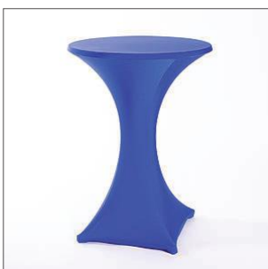
Stretchhuse für Stehtisch blau Artikel-Nr. 210048 schwarz Artikel-Nr. 210047 ecru Artikel-Nr. 210041 gelb Artikel-Nr. 210042 grau Artikel-Nr. 210043 rot Artikel-Nr. 210044 weiß Artikel-Nr. 210045 grün Artikel-Nr. 210046 Ø 80 cm, H: 112 cm

Katalog mit Miet- mobiliar, Technik und Zubehör unter: www.creatyp.de