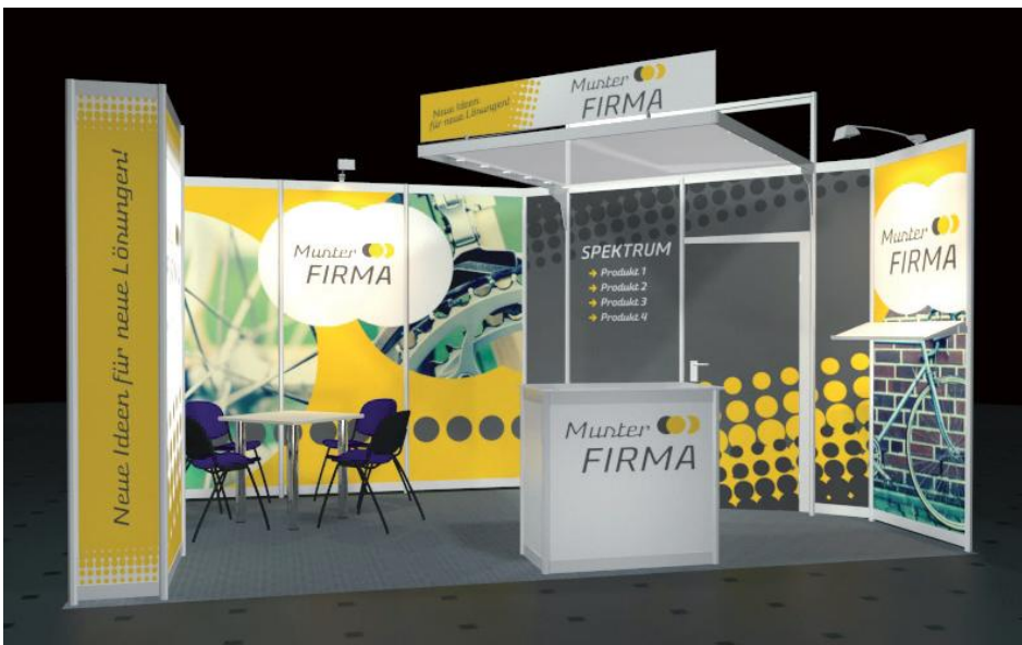
Gestaltungs- und Ausstattungsbeispiel* Reihenstand 5 x 3 m