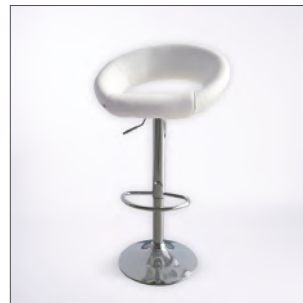
Artikel-Nr. 552 Barhocker Rio weiß, Kunstleder, höhenverstellbar Gestell: Metall in Chromoptik Sitzhöhe: 63 – 83 cm