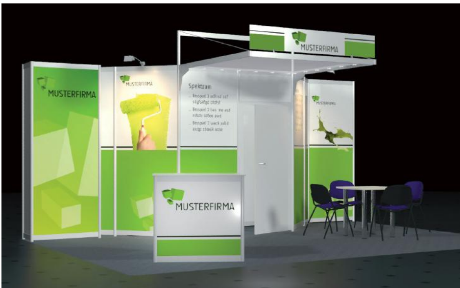
Gestaltungs- und Ausstattungsbeispiel* Kopfstand 6 x 4 m

Die Beispiele auf dieser Seite zeigen mögliche Sonderausstattungen, die nicht im Basispreis enthalten sind. Wir beraten Sie gern!