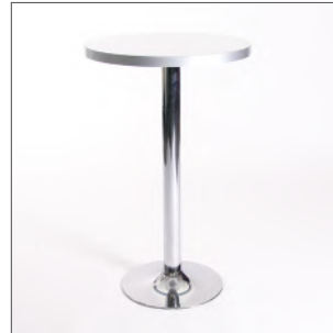
Artikel-Nr. 201007 Stehtisch elegance Ø 70 cm, H: 112 cm