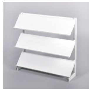
Artikel-Nr. 557 Prospektständer Alugestell, 3 Ablagen weiß 100 cm breit