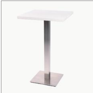
Artikel-Nr. 483 Stehtisch Edelstahl/Weiß 70 × 70 cm, H: 110 cm

Zusätzlich zum Basisstand könnte Sie dieses Mietmobiliar interessieren: