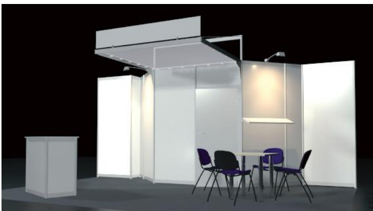
Beispiel Kopfstand 6 x 3 m