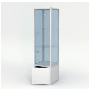
Artikel-Nr. 508 Glasvitrine beleuchtet, verschließbar 50 × 200 × 50 cm