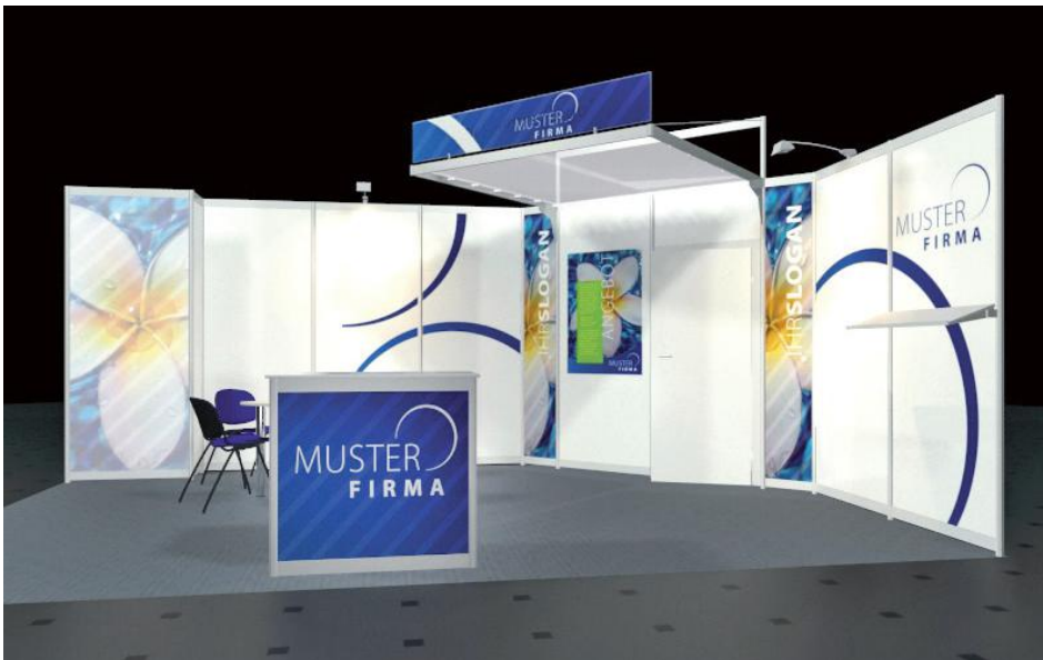
Gestaltungs- und Ausstattungsbeispiel* Eckstand 6 x 4 m