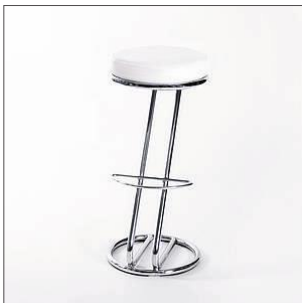
Artikel-Nr. 220111 Barhocker, weiß Gestell Chrom, Leder weiß Ø 35 cm, H: 79 cm