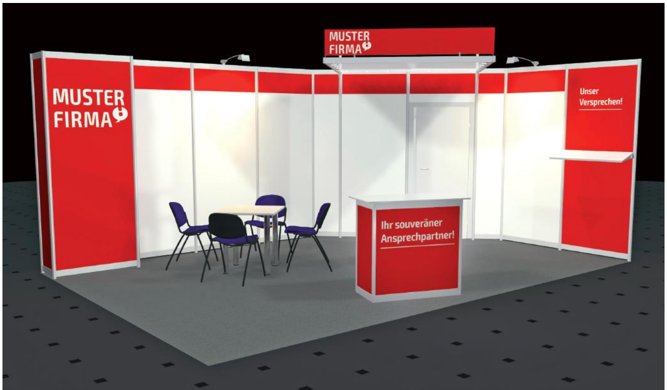
Beispiel Eckstand 6 x 4 m *